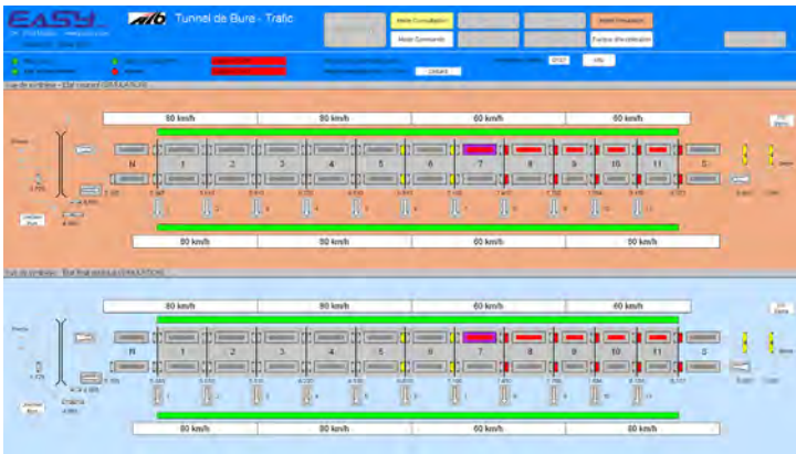
Tunnel „Bure“: Ansicht der Geschwindigkeits-Segmente