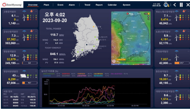
Panoramica sulle prestazioni dei nove impianti eolici a energia solare sparsi sul territorio