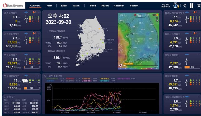
Visão geral do desempenho das nove usinas eólicas e solares dispersas.